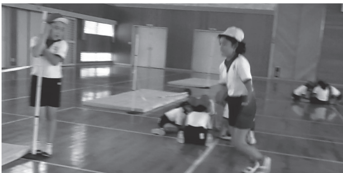
図4 話し合いの様子