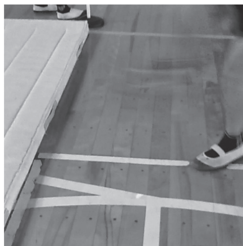
図 5.6 踏み切り足の角度