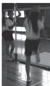
図 7 踏切