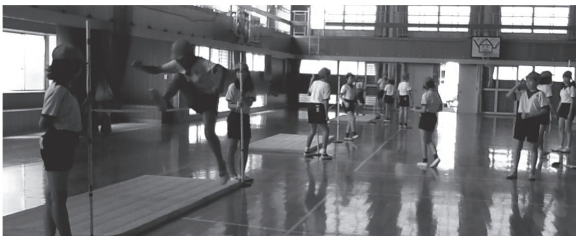
図 2 教場全体の様子 11

ここで授業内容を簡単に紹介する。授業は、第 4 学年クラス（計 24 人）の「走り高跳び」で、体育館を教場として実施された（図 2 は教場全体の様子）。班編成はクラスでの生活班を利用し、各班 4 人ずつの 6 班であった。子どもたちが自分の動きを客観的に見ることにより、「分かる」と「できる」のずれを埋める効果があるのかを検証するために、各班に 1 台ずつ iPad 10 を配布し、試技の際、空中動作などを撮影させた。撮影後、すぐに班で集まり、動画を再生し、それを見ながら話し合いをさせた。なお、子どもたちは今回の授業において初めて iPad を使用した。また、授業者は、当初、単元全 6 時間のうち、2 時間目から 6 時間目で iPad を子どもたちに使用させる予定であったが、実際に使用させたのは、2 時間目から 4 時間目であった。