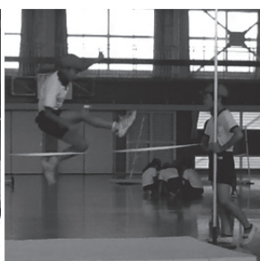
図 8 空中動作 (振り上げ足)