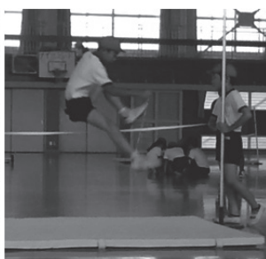
図 9 空中動作 (抜き足)