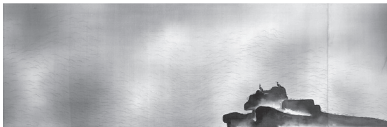
図9－2 《生々流転》部分 横山大観 1923年 東京国立近代美術館蔵 重要文化財