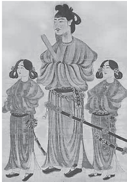
図6 《唐本御影》 8世紀頃 皇室御物