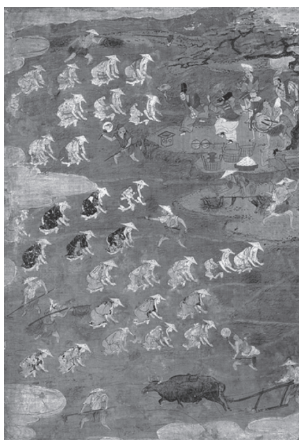
図 11 《月次風俗図屏風》部分 16 世紀 東京国立博物館蔵 重要文化財