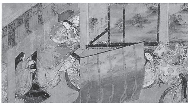
図4 《源氏物語絵巻》部分 平安時代末期 東京国立博物館蔵 国宝