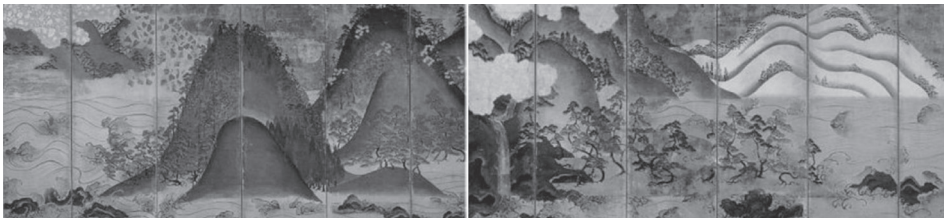
図7 《日月山水図屏風》 15 - 16世紀 金剛寺蔵 重要文化財