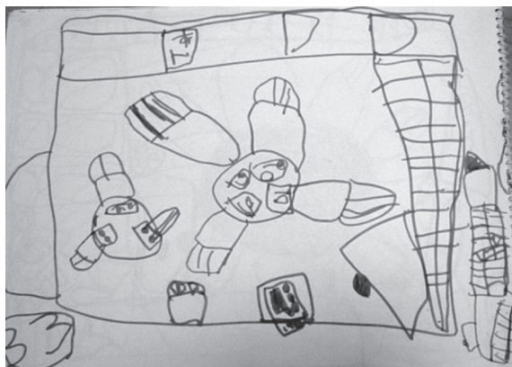
図 12 年中女兒

展開図式とは、展開図のように立体を開いて描くことである。図 12 の絵は、部屋を真上から見たように描かれている。テーブルを囲んでいる椅子に注目すると、上からでは見えないはずのない背もたれの木の模様まで描かれている。《祇園社境内絵図》(図 13) は、祇園社の境内の様子を真上から俯瞰して描いた作品であるが、図 12 の子どもの絵と同じように真上からでは見えないはずのない建物の壁面が描かれている。また各建物の方向を見てみると、画面の上下に合わせた建物の描かれ方はしておらず、廻廊に沿って建物の天地が決められていることがわかる。この表現方法は、視点移動の描法と同じく、実物の見える通りではなく、よりその物らしく描こうとした結果だといえる。