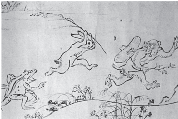
図2 《鳥獣人物戯画》甲巻部分 12 - 13世紀 東京国立博物館蔵 国宝