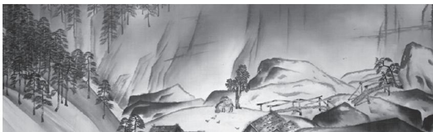
図9－1 《生々流転》部分 横山大観 1923年 東京国立近代美術館蔵 重要文化財