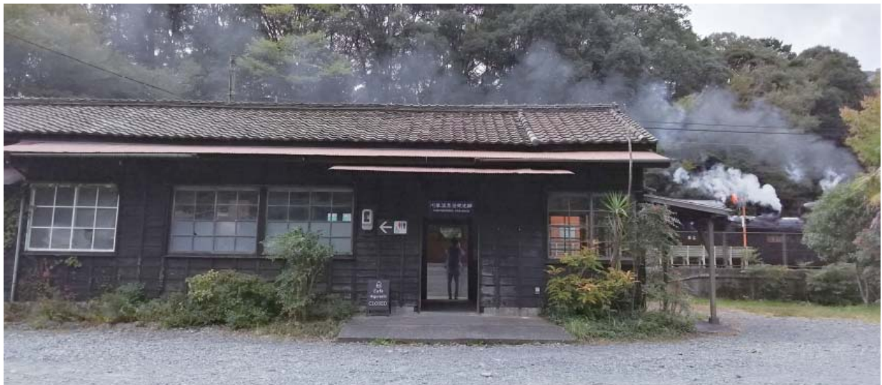
川根温泉笹間渡駅舎