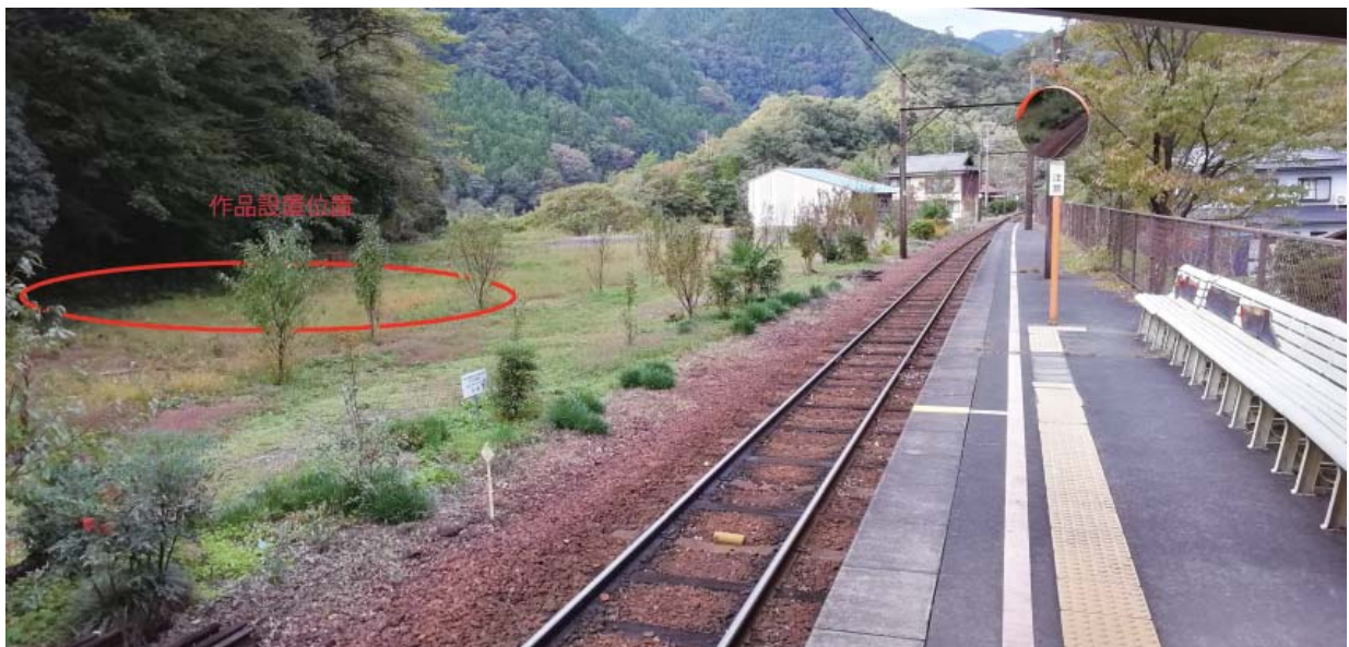
プラットフォーム