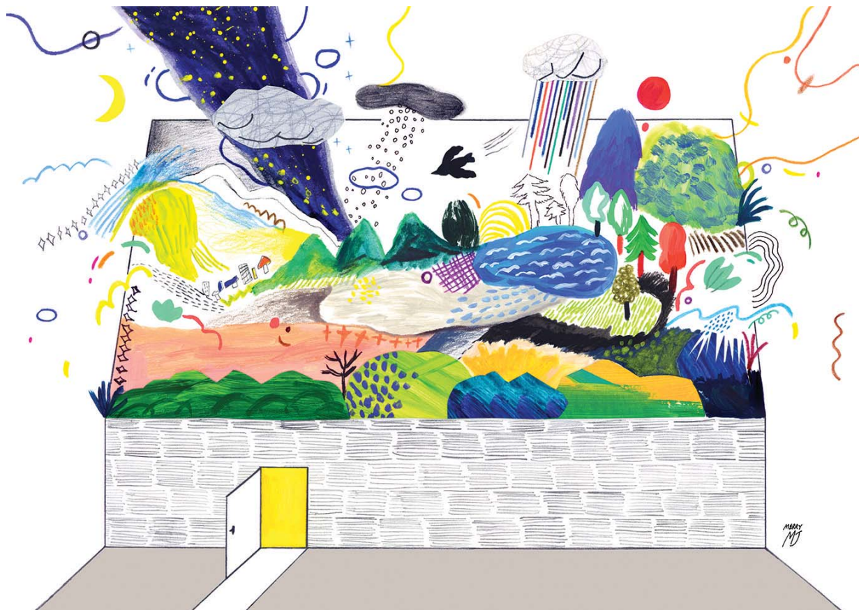
「風に乗って」、594x420mm、アルシュ紙、Mixed media on paper、2017年制作