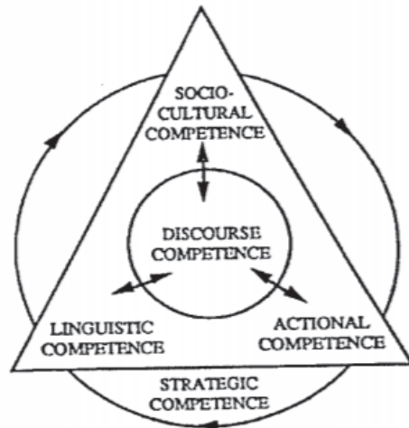
図2: Celce-Murcia, Dornyei, & Thurresl (1995) のコミュニケーション能力モデル

次に三角形にある構成要素を見ていく。左下にある言語的能力 (linguistic competence) は、語彙や文法的な知識である。下位項目としては、統語論、形態論、(受容&