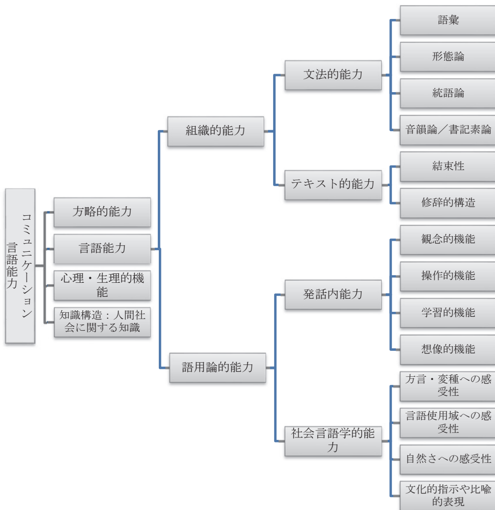
図 1: Bachman (1990) のコミュニケーション言語能力のモデル

4) 知識構造：人間社会に関する知識（knowledge structure : knowledge of the world）は「関連づけるための社会文化的知識，および『実社会の』知識」である。（Bachman, 1990 : 98）